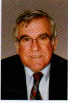
Mümin CEYHAN ÇEK Başkanı