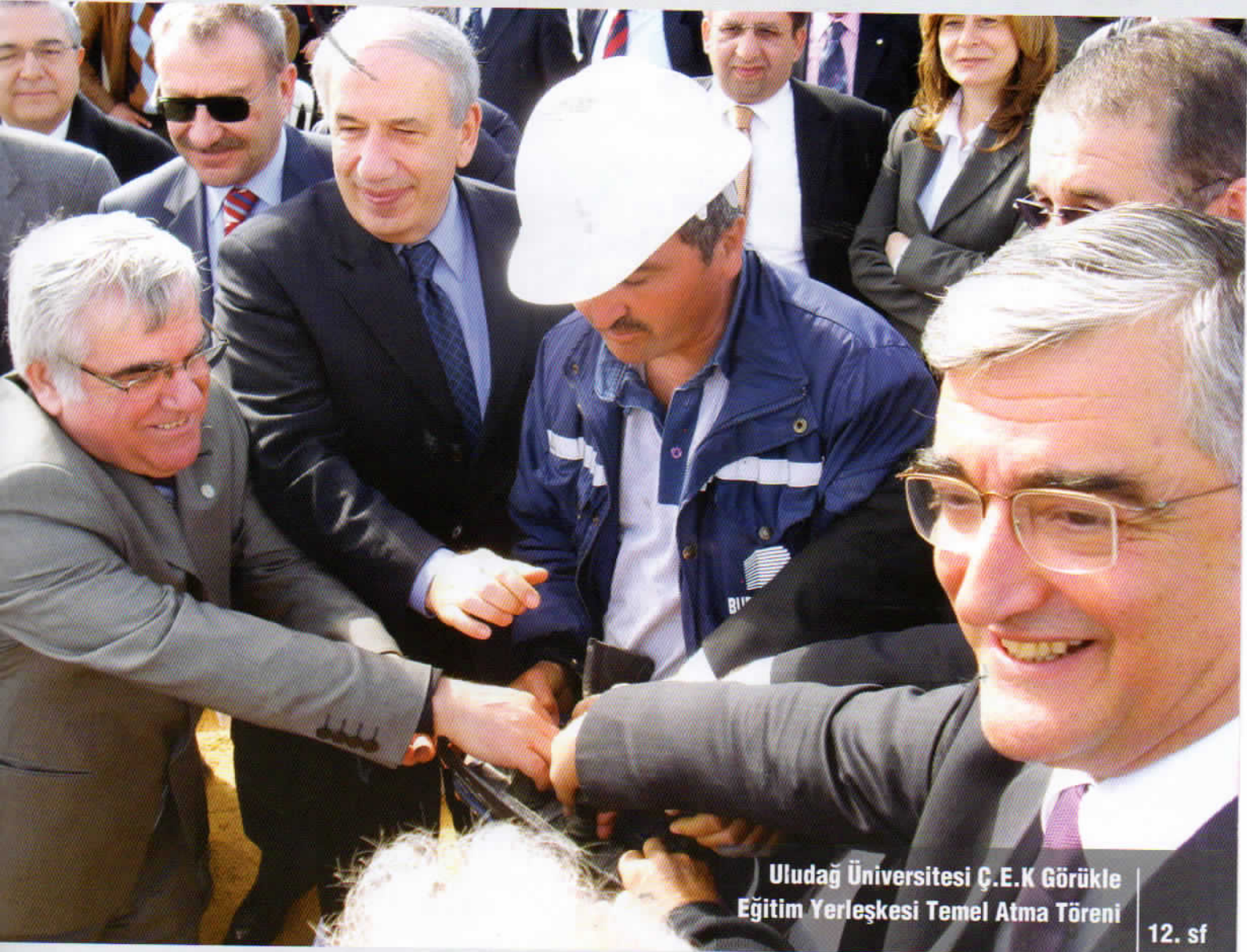
Uludağ Üniversitesi Ç.E.K Görükle Eğitim Yerleşkesi Temel Atma Töreni