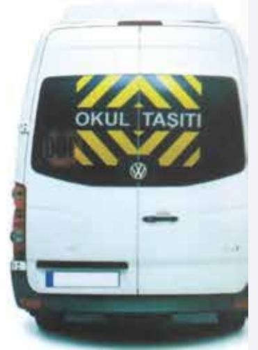
OKUL SERVİS ARAÇLARI