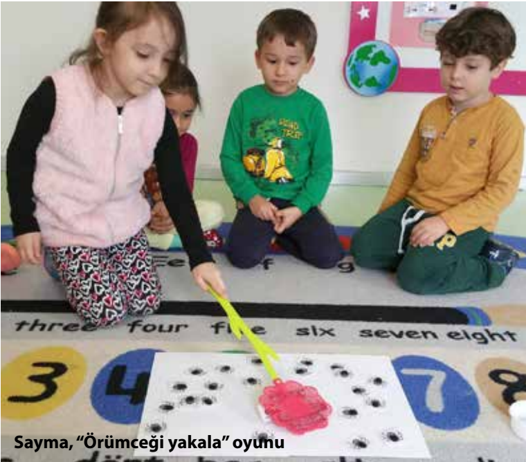
Sayma, "Örümceği yakala" oyunu