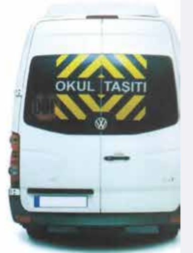
OKUL SERVİS ARAÇLARI