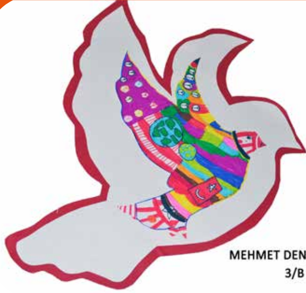
MEHMET DENİZ AĞÜN 3/B