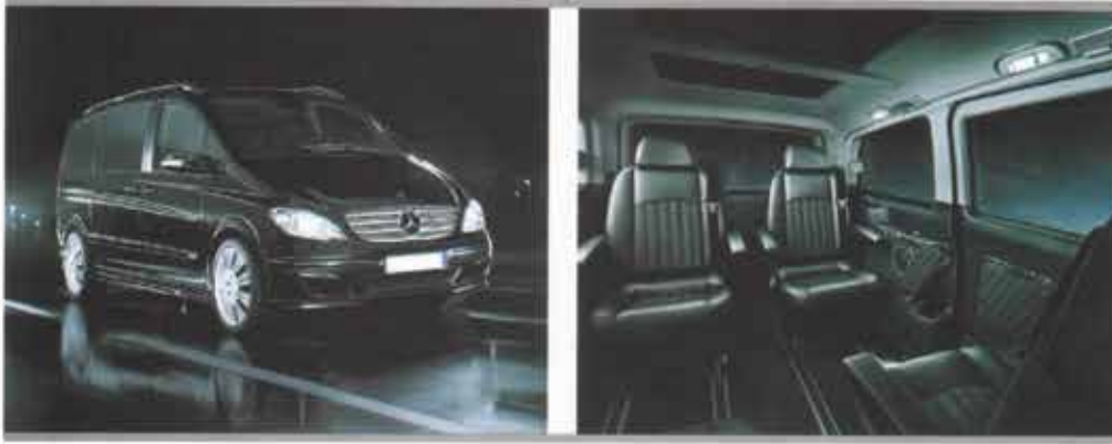
VIP TRANSFER ARAÇLARI

KALİTELİ ARAÇLAR UZMAN KADRO MÜŞTERİ MEMNUNİYETİ için Tek marka EgeSeR