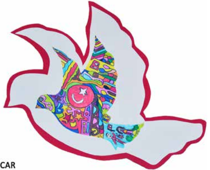
EFE SUCAR 3/E