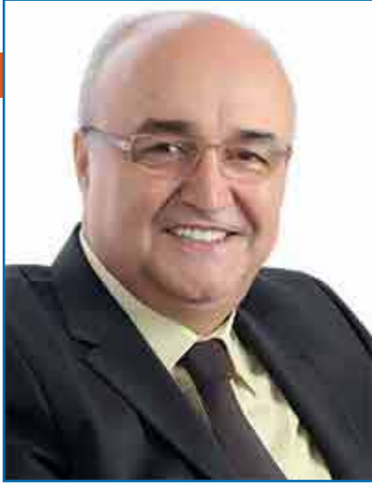
Ahmet Emin Yılmaz / Olay Gazetesi