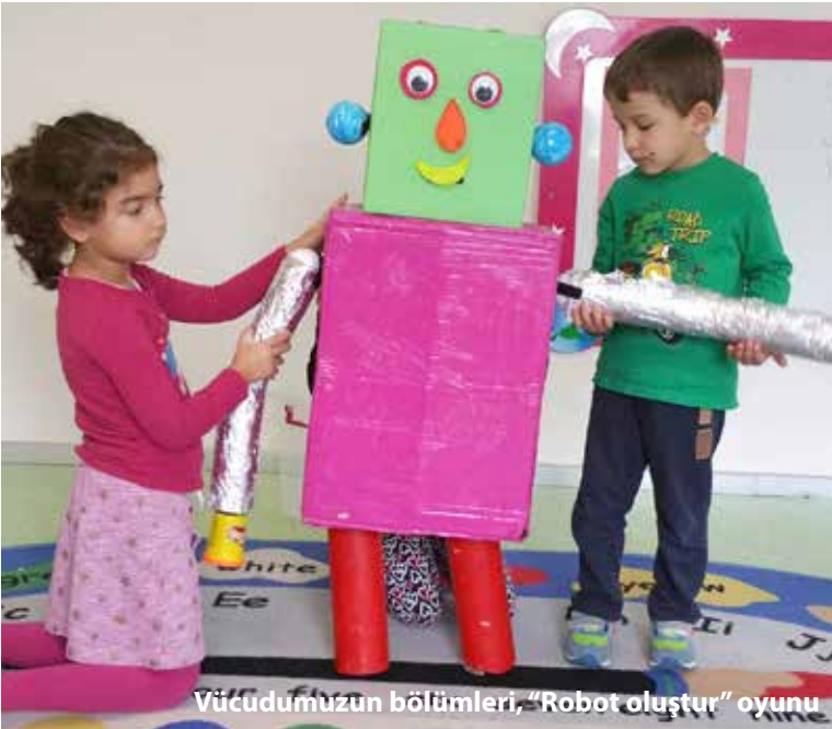
Vücudumuzun bölümleri, "Robot oluştur" oyunu

İnsan hayatında sihirli zaman olarak nitelendirilen okul öncesindeki doğal öğrenme yeteneği, merak dürtüsü ve araştırma isteği yeni bilgi kazanımında; yetişkinlere oranla çocuklar için büyük avantaj sağlamaktadır. Bu avantaj yabancı dil öğreniminde de oldukça ön plandadır.