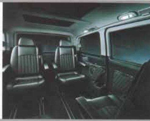
VIP TRANSFER ARAÇLARI