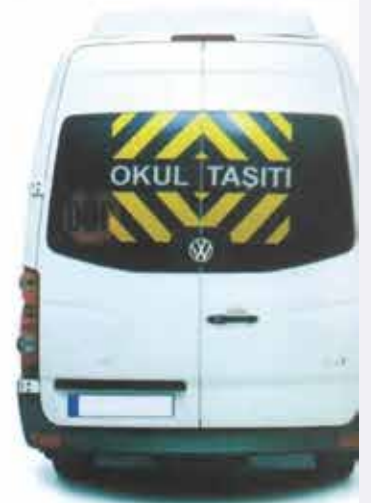
OKUL SERVİS ARAÇLARI