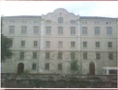
FARUK SARAÇ TASARIM AKADEMİSİ (FABRİKA-İ HÜMAYUN)